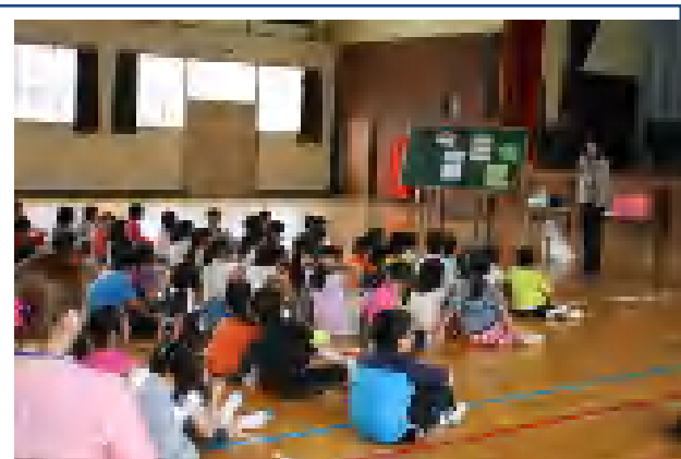
家庭教育学級でも「親子栄養教室」が開催されました。(於：鉾田小体育館 H24.6.21)

児童の様子をみても、運動好きな児童と運動を好まない児童の二極化もみられます。特に肥満気味の児童は、運動を好まなくなる傾向が自然に出てきてしまいます。正しい食の在り方を身に付け、運動にも親しみながら、児童期からの健康な体づくりを進めましょう。