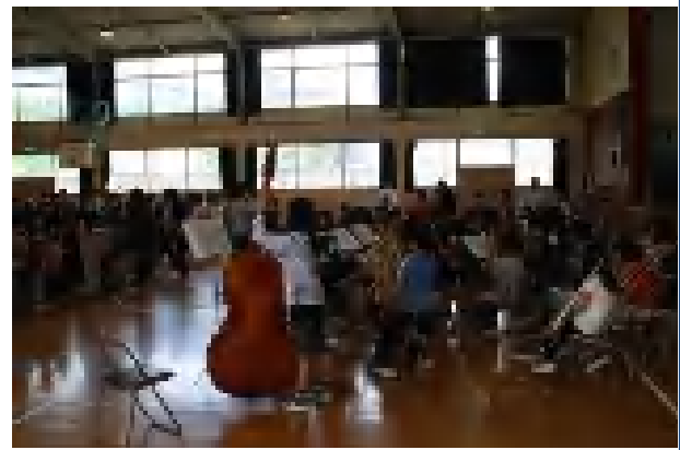
音楽朝会で全校児童を前に演奏する吹奏楽部児童たち。(於：体育館 H24.6.15)

15分程の時間ですので、鉾田小の良さをすべて視てもらうことは難しいですが、今後とも鉾田小の特色を発信できるようにご理解・ご協力の程お願い申し上げます。